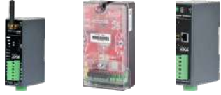
HT G11 HT G21 HT E21